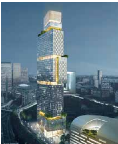
Tour des Jardins de l'Arche

Avec plus de 8 millions de touristes de loisirs et d'affaires par an, Paris La Défense est une destination prisée. Avec le renforcement de son offre hôtelière et de nouvelles infrastructures, le quartier d'affaires va accroître son attractivité.